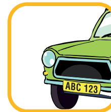
Signalisation & Logos