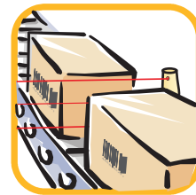
Tri et Convoyage