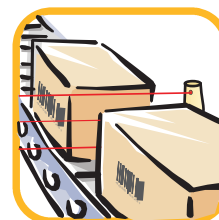
Smistamento e trasporto