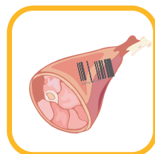
Contact alimentaire direct